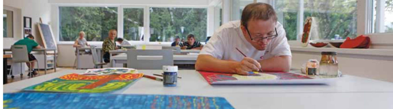
Lichtdurchflutete Räume prägen das Bild des rundum sanierten Ateliers de La Tour in Treffen.

kann man sich mit dem Stichwort „Herrnhilf“ unter 0810 / 955 065 beraten lassen.