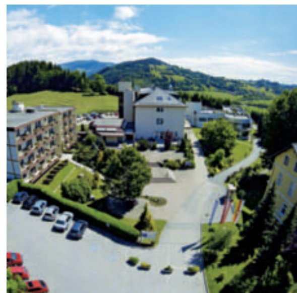
„Haus Philippus“ gegenüber dem „Ernst-Schwarz-Haus“