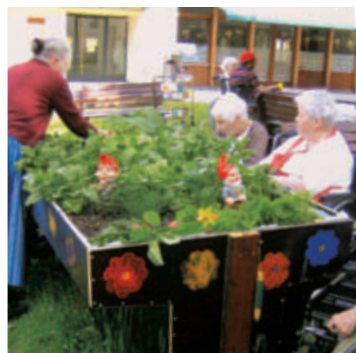
Bewohnerinnen beim Hochbeet

PH Regina Karnel Haus Elvine und Bethanien